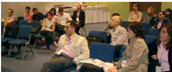
Presentación de Proyectos de Investigación en el Congreso SEPAR Barcelona 2007

Proyectos de investigación: En la reunión de invierno como el Congreso se presentaron proyectos de investigación, tanto los ya iniciados como nuevos. Todos ellos están dentro de los Programas Integrados de Investigación (PII) y es nuestra intención que toda la investigación en sueño que se realice en España se haga a través de los PII de sueño.