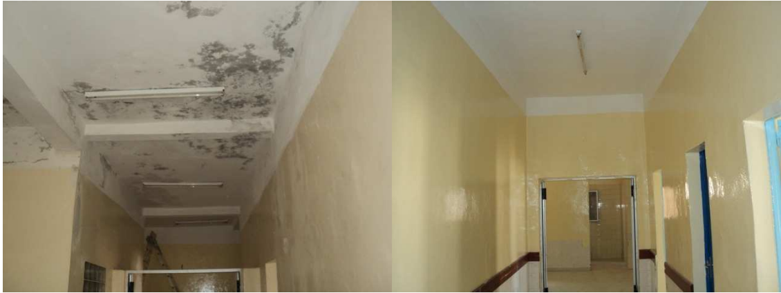
Impermeabilización y pintura de la zona interior más deteriorada de centro nº 3