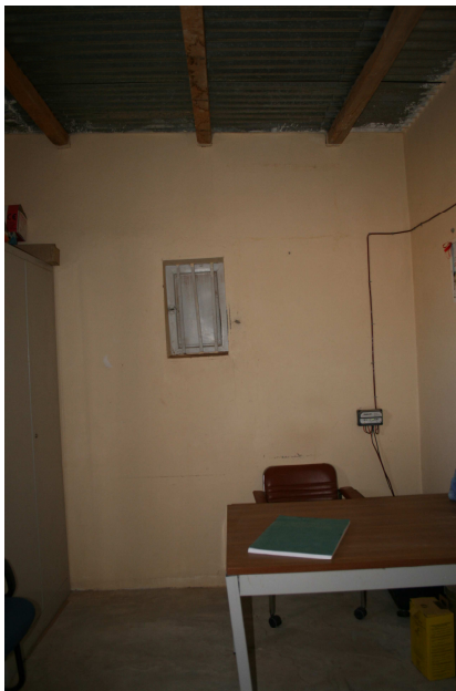
Sala del consultorio de Inal antes de la reforma

El Ayuntamiento de Inal, a través de su alcalde Mohamed Ahmed Brahim, nos solicitó en el año 2007, ayuda para acondicionar el consultorio del que disponía el ayuntamiento, el cual carecía de las condiciones mínimas necesarias para atender dignamente a la población.