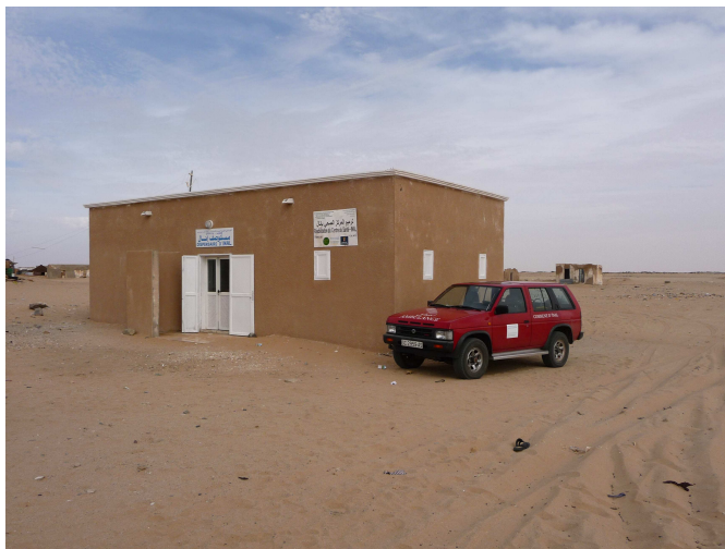
Aspecto externo del Dispensario una vez finalizadas las obras y la ambulancia