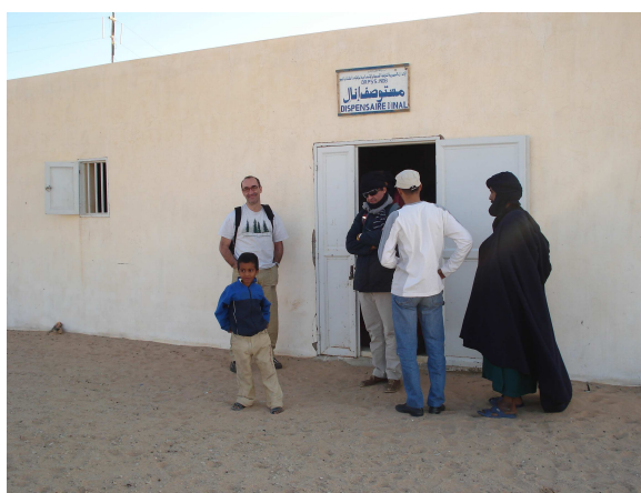
Aspecto externo del Dispensario antes de la reforma

La comunidad de Inal no dispone de carreteras y el único medio de transporte es el ferrocarril, que une el pueblo con la región Dakhlet Nouadhibou, la segunda ciudad del país con una población de 100.000 habitantes. El comercio en el municipio se limita a siete tiendas que no cubren las necesidades de los habitantes en productos alimentarios.