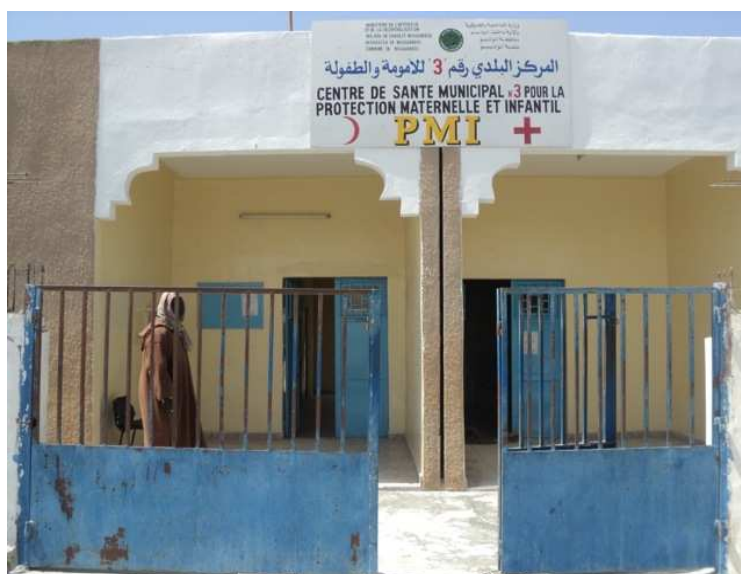
Adecuación de la entrada al centro nº 3

Se adjuntan fotos ilustrativas de las mejoras realizadas.