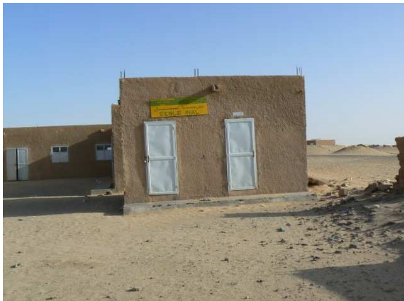
Aspecto exterior de la escuela de Inal antes de la reforma

3. Proyecto de reforma de la escuela de Inal: Además del dispensario, la escuela de Inal utilizada por aproximadamente 70 niños (muchos de ellos nómadas y sin asentamiento permanente) se encontraba en una situación penosa. Las dos aulas que se podía usar carecían de cimentación, el suelo de las mismas era de arena, las ventanas no cerraban y no disponían de aseos.