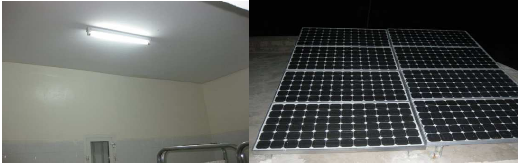
Dispensario iluminado tras la instalación de las placas fotovoltaicas