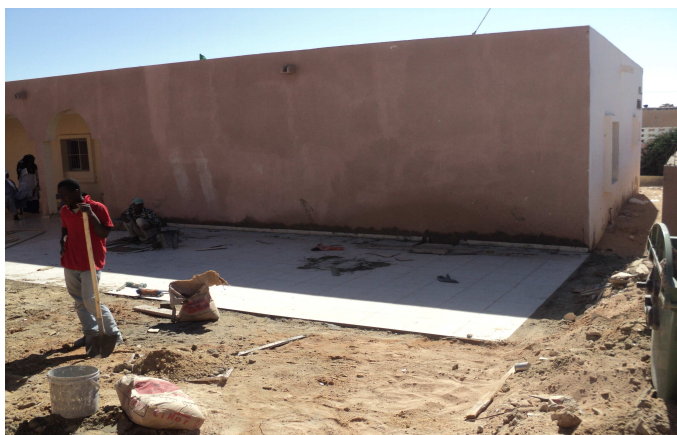
Unidad durante su construcción en 2010

A continuación se muestran imágenes de la construcción de la Unidad en 2010