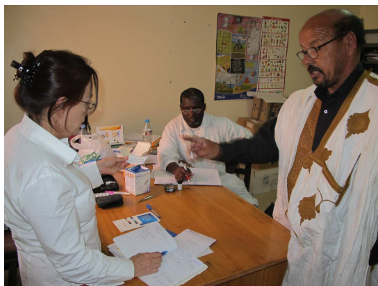
Interior de Consultorio de la Unidad ya terminada