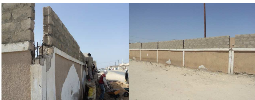
Reforzamiento y elevación de la valla perimetral del centro nº 3