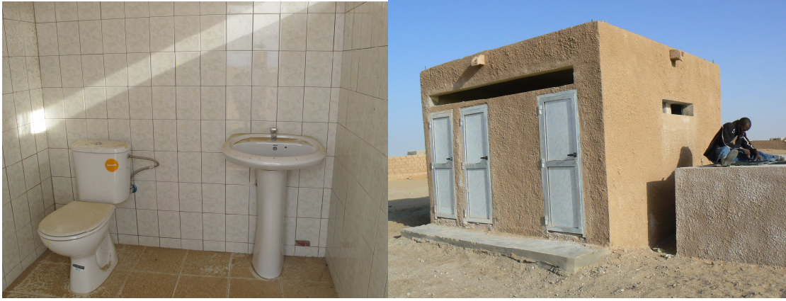
Zona de aseos de la escuela de Inal tras la reforma