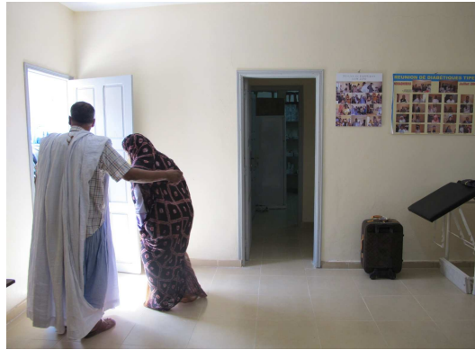
Otra vista del consultorio principal

En 2012 y gracias a una ayuda del Cabildo de Gran Canaria se ha acondicionado el exterior de la Unidad y se ha elevado el muro perimetral de la Unidad de diabetes, ya que era muy bajo y ello facilitaba la entrada de animales, como cabras, en el recinto sanitario. Además, se adecentó la entrada al centro, lo que supuso instalar piso a un espacio de 86 m2, que hasta ese día era de tierra, lo que dificultaba la higiene dentro de este Centro de Salud.