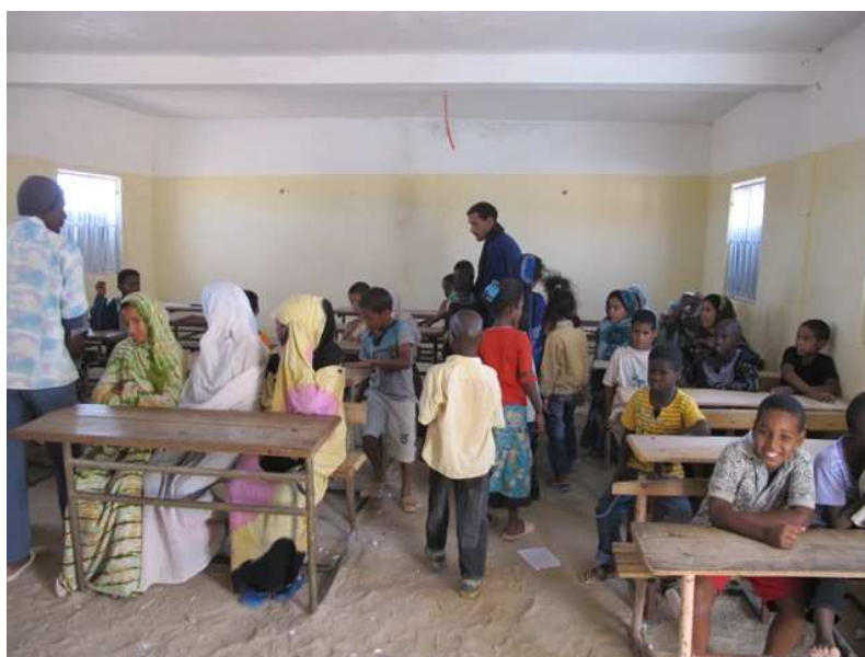
Una de las dos aulas antes de las obras de rehabilitación

Gracias a una ayuda de 15.000 euros concedida por el Cabildo de Gran Canaria en 2010 se pudieron efectuar obras de acondicionamiento de dos de las cuatro aulas y la construcción de 4 aseos y una ducha.