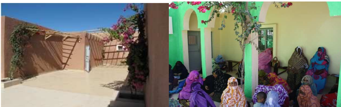
Aspecto del exterior de la Unidad de Diabetes acondicionada y que se usa como sala de espera