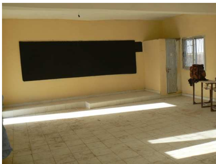
Una de las aulas tras las obras de adecuación

En 2011 y nuevamente con la ayuda del cabildo de Gran Canaria se dotó de dos placas fotovoltaicas para la producción de la energía eléctrica mínima necesaria para el correcto funcionamiento del alumbrado y de enchufes de 2 aulas así como de un motor para sacar el agua del aljibe y que se pudiera utilizar para los aseos y baños de la escuela.