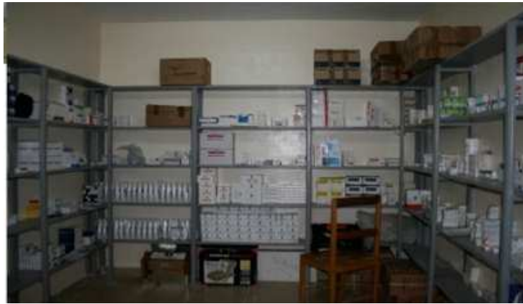
Imágenes del almacén con la nevera en las que se guardan las insulinas